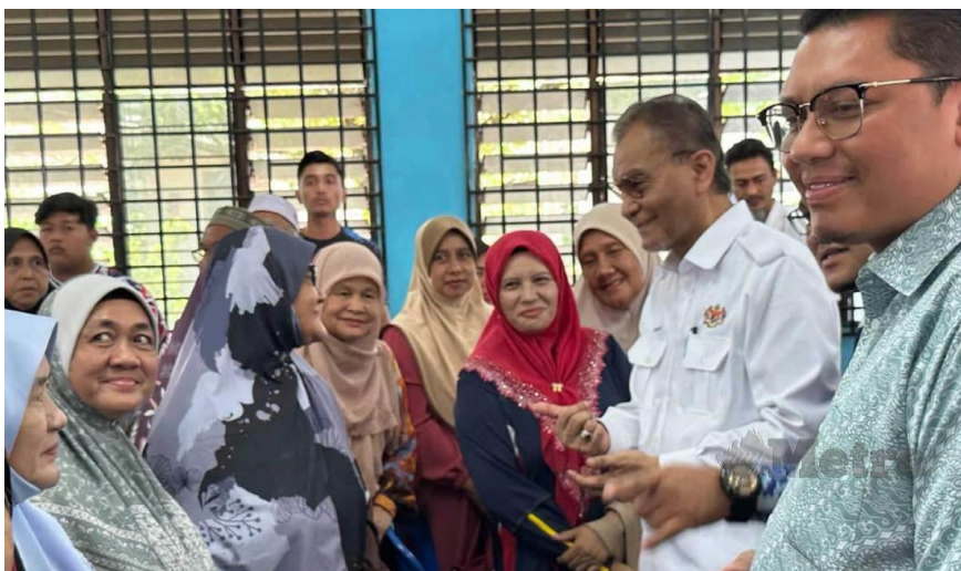
DR Dzulkefly (dua kanan) bertemu mata dengan penduduk Jeram Tekoh selepas merasmikan Kem Kesihatan Minda, Kunci Kesejahteraan Warga Emas, di Jeram Tekoh.