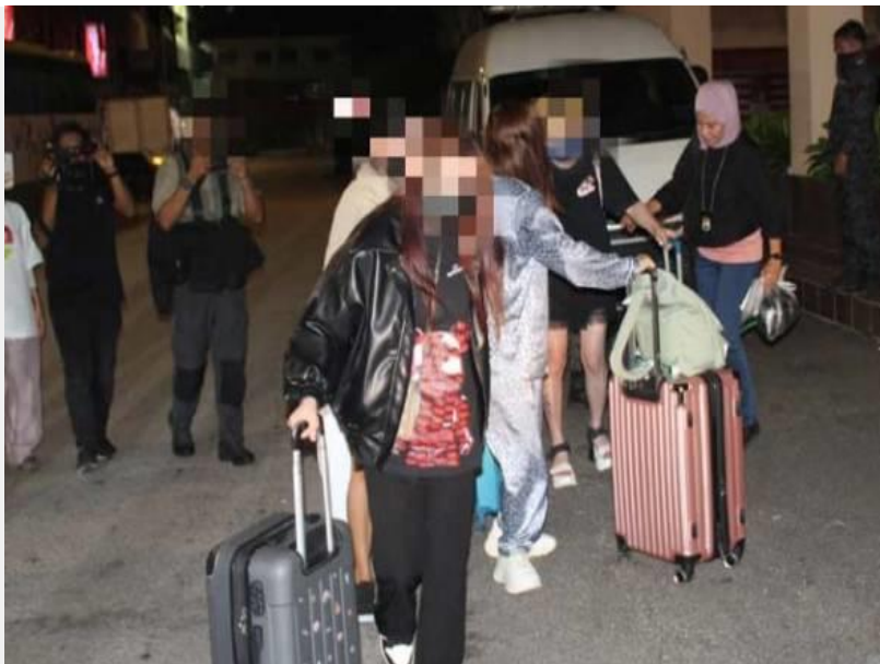
Kesemua wanita yang berumur antara 25 dan 37 tahun itu terdiri daripada warga Vietnam, Indonesia dan Thailand, manakala pekerja lelaki ditahan yang adalah warga India dan Bangladesh.